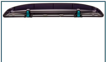
Bladgeleider (1 stuks)