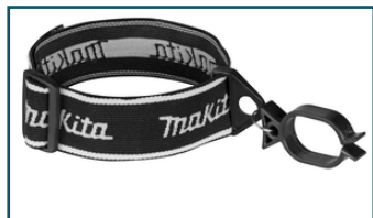
Koordhouder armband (1 stuks)