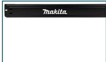
Transportbescherming 45cm (1 stuks)