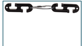
Stekker Vergrendeling (1 stuks)