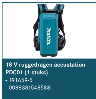
18 V ruggeddragen accustation PDC01 (1 stuks) - 191A59-5 - 0088381548588