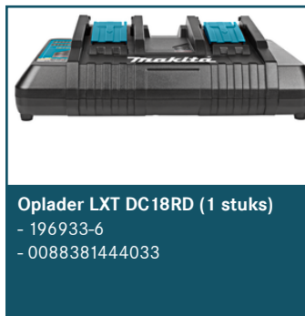
Oplader LXT DC 18RD (1 stuks) - 196933-6 - 0088381444033