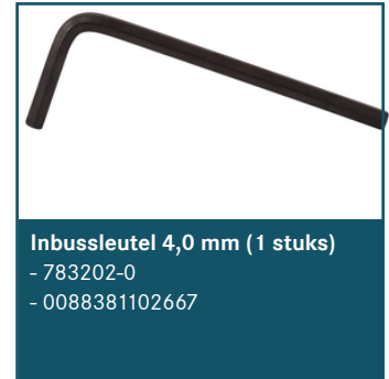
Inbussleutel 4,0 mm (1 stuks) - 783202-0 - 0088381102667