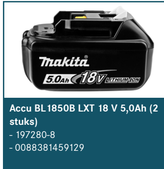
Accu BL 1850B LXT 18 V 5,0Ah (2 stuks) - 197280-8 - 0088381459129