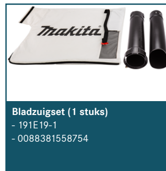
Bladzuigset (1 stuks) - 191E19-1 - 0088381558754