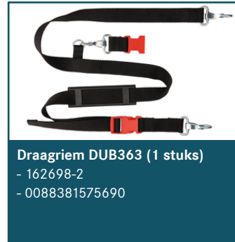
Draagriem DUB363 (1 stuks) - 162698-2 - 0088381575690