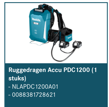
Ruggedragen Accu PDC1200 (1 stuks) - NLAPDC1200A01 - 0088381728621

Dit is slechts een kleine greep uit het ruime assortiment. Kijk voor alle accessoires/verbruiksartikelen in de Catalogus of op www.makita.nl .