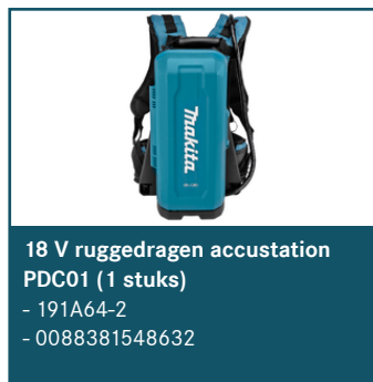
18 V ruggeddragen accustation PDC01 (1 stuks) - 191A64-2 - 0088381548632