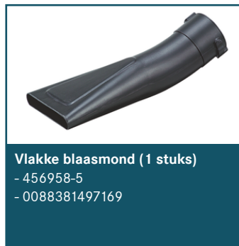
Vlakke blaasmond (1 stuks) - 456958-5 - 0088381497169